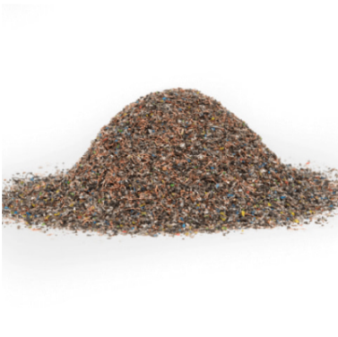
Kupferraff mit Edelmetall