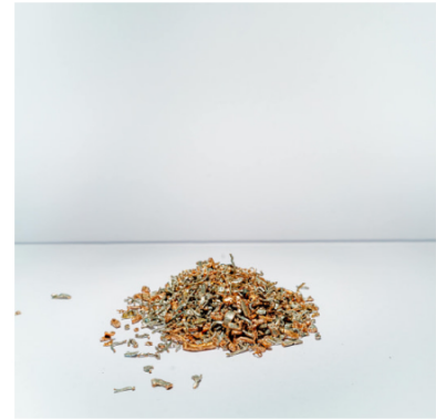
Kupfer mit galvanisierten Anteilen