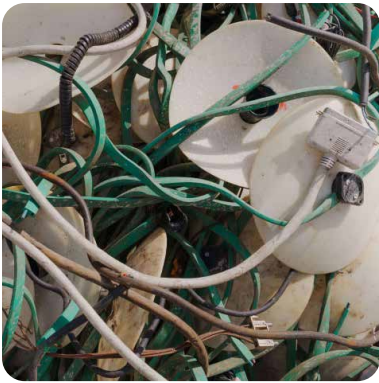
Kabel mit hohen Fremdanteilen